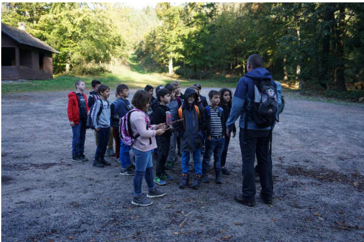
Am zweiten Tag ging es auf eine große Tageswanderung mit Wanderführern des Schwarzwaldvereins.