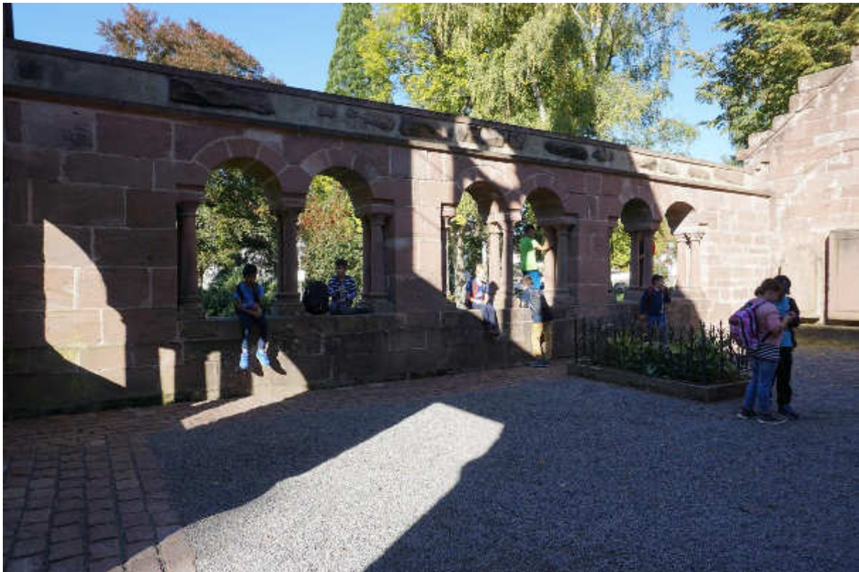
In Bad Herrenalb haben wir die Klostersruine erkundet.