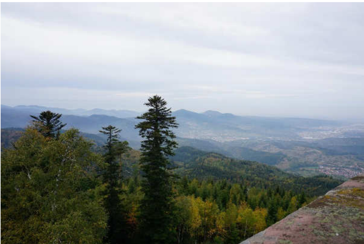
Vom Turm der Teufelsmühle hatten wir einen tollen Blick auf den Schwarzwald.