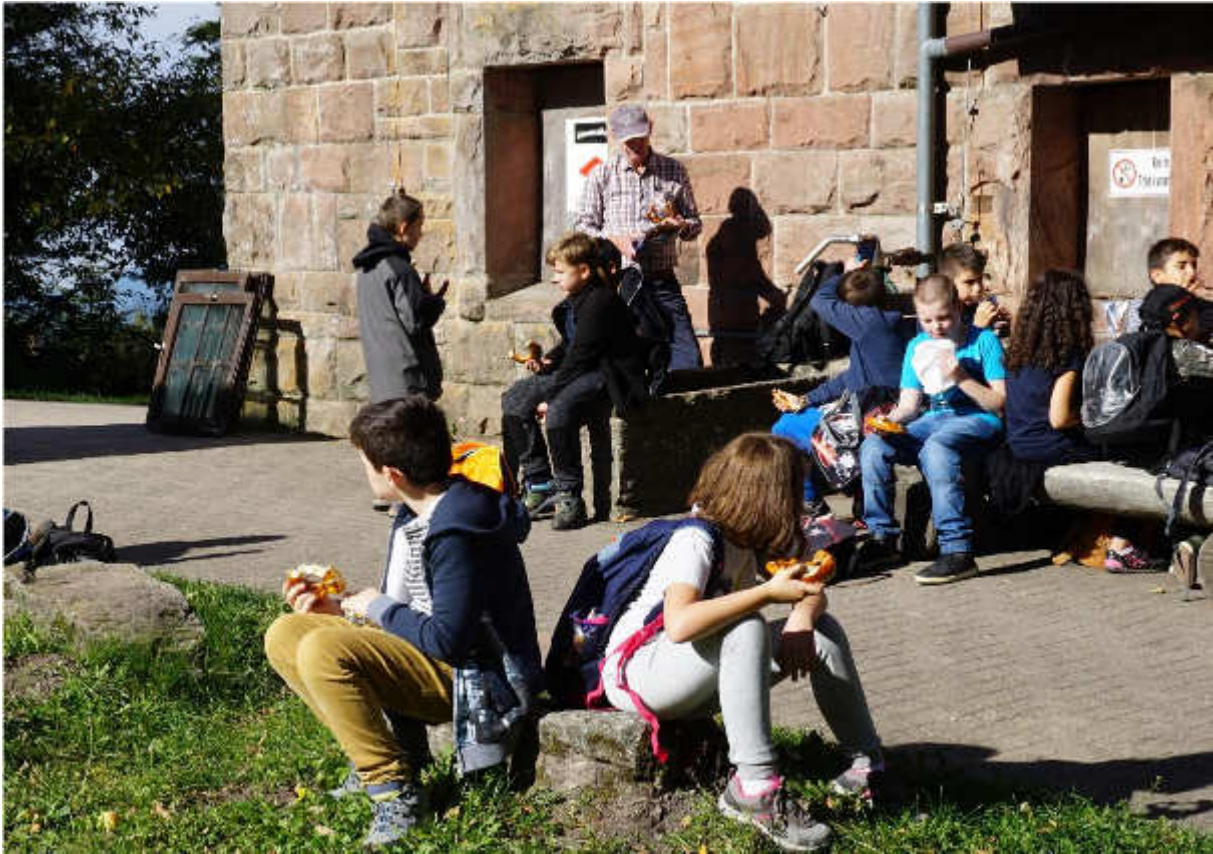
Mittags an der Teufelsmühle angekommen, wurden wir mit einem zünftigen Vesper vom Schwarzwaldverein belohnt.